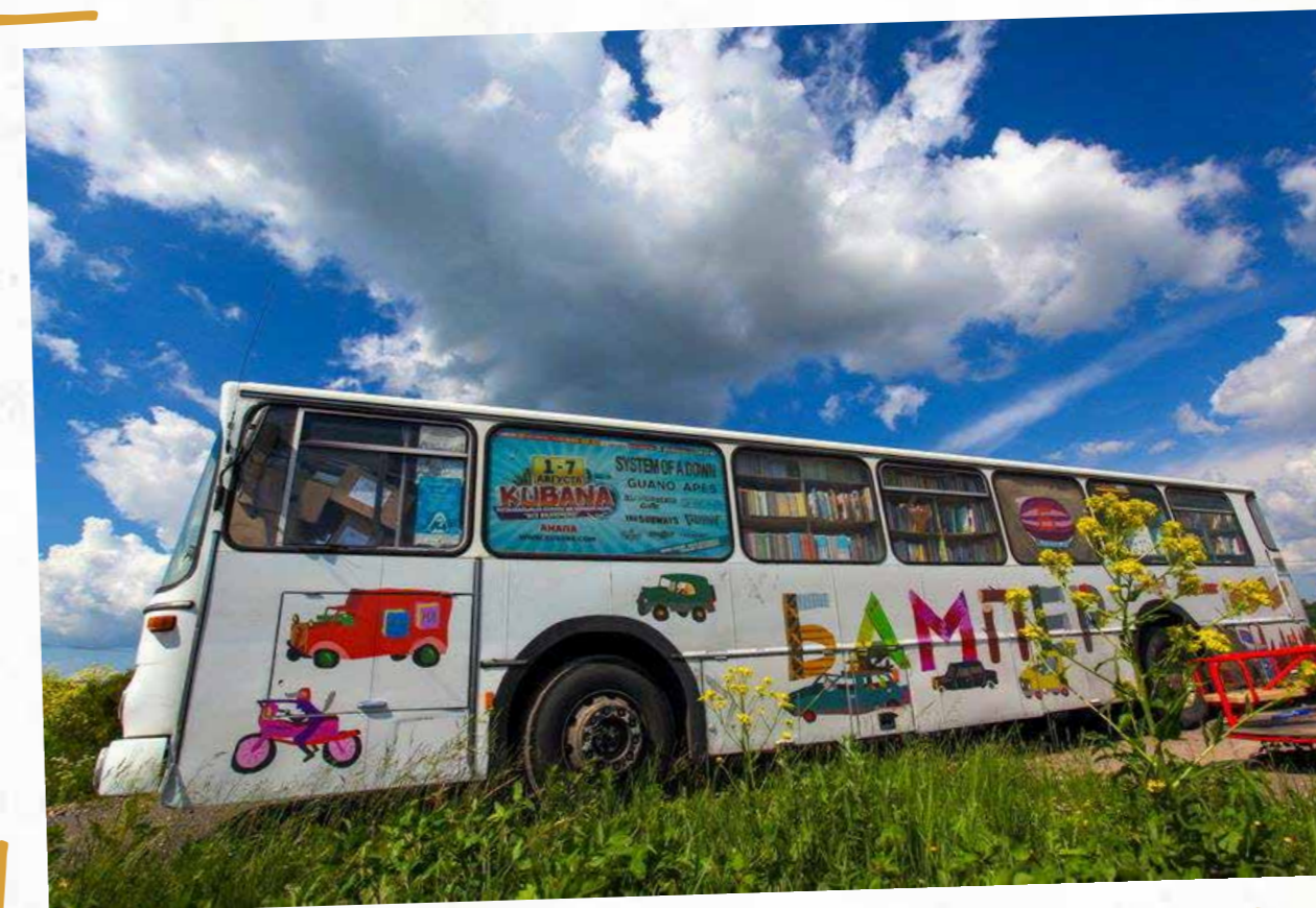
АРХСТОЯНИЕ ДЕТСКОЕ 2017