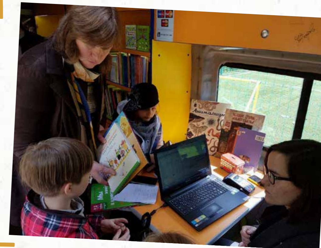
ВСТРЕЧА В KIDS OFFICE GYMNASIUM - ШКОЛА ЖИЗНИ