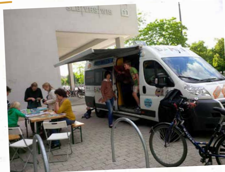
БАМПЕР В БЕРЛИНЕ