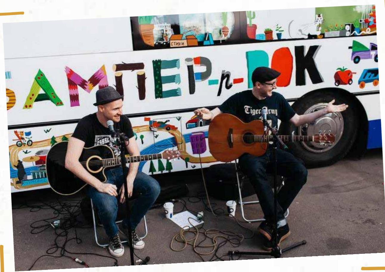
ОТКРЫТИЕ БАМПЕРА В МУЗЕОНЕ

СПЕКТАКЛЬ СТОРИТЕЛЛЕРА И СКАЗОЧНИКА ИЗ ИРЛАНДИИ ДЖО БРЕННАНА